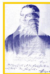
Fabio Bazzani Esperienza del tempo Studio su Hegel pp. 138, Euro 12,90

È in questo autocontraddirsi, in questo aprirsi all'oltre da sé, che la filosofia di Hegel continua a mostrare capacità rappresentative di quanto nel tempo della nostra esistenza e nel tempo della nostra storia facciamo esperienza.