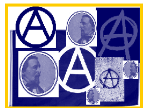
Wilhelm Marr Anarchia o autorità? a cura di Francesca Crocetti pp. 100, Euro 11,90

Un tale e contraddittorio insieme di sollecitazioni viene a formare la base stessa del pregiudizio antiebraico che dall'Ottocento ad oggi accomuna molte componenti della sinistra europea. L'aspetto forse più interessante della riflessione di Marr è proprio questo: l'intreccio inedito, poco