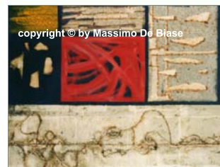
disegno di Massimo De Biase