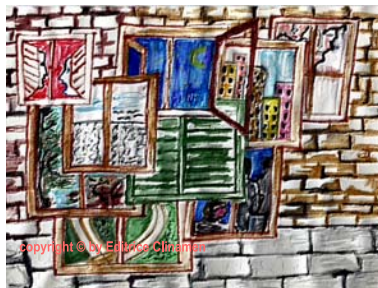
disegno di Norma Tassoni

Questa seconda Newsletter del mese di aprile è dedicata al catalogo dei titoli disponibili , di quelli esauriti e di quelli posti definitivamente fuori catalogo. Sono anche presenti le classifiche di vendita mensili e trimestrali.